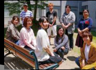
福山大学メディア・映像学科