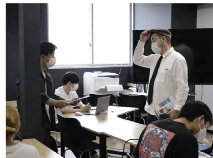
▲ オリエンテーションの様子