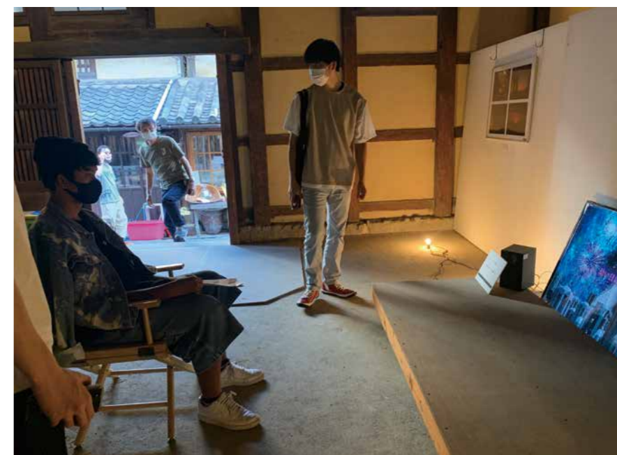
▲ 昨年のイベントリサーチ